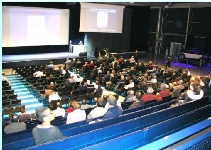
Les auditeurs étaient nombreux pour suivre ces deux exposés très intéressants