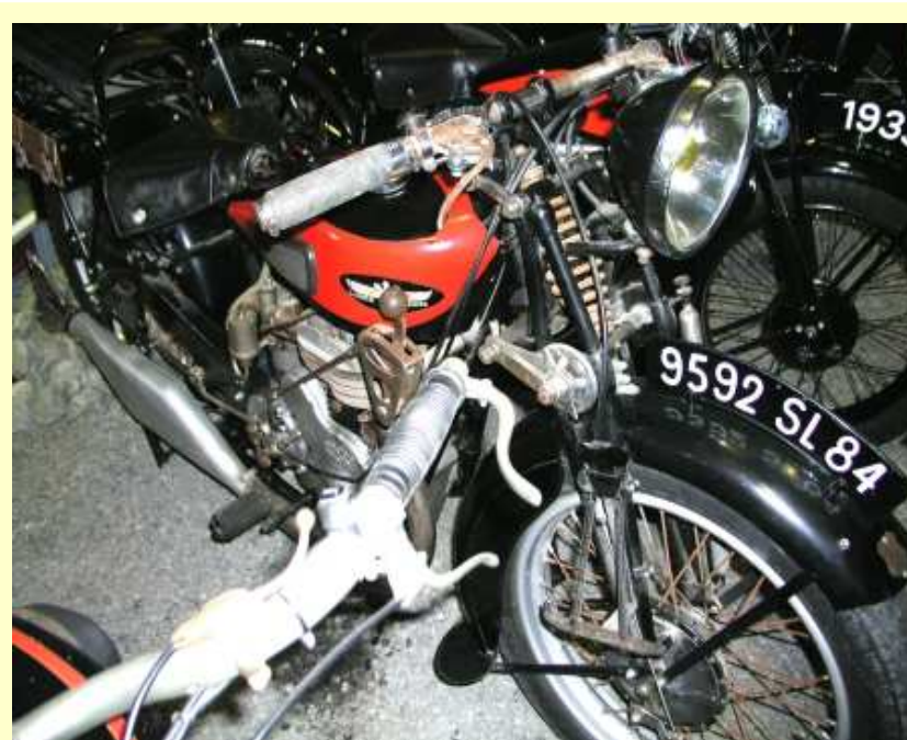
La moto M2 a été installée dans la galerie des motos du Musée (24/01/2018)