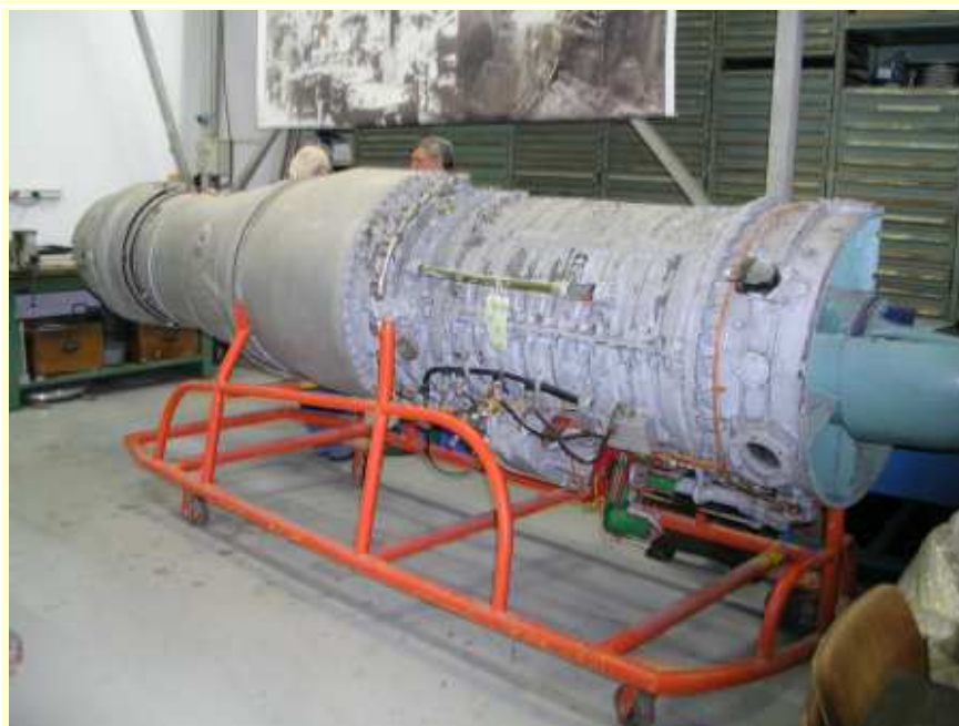
L'ATAR 8C2 est pris en charge pour restauration, ces moteurs avionnaient l'Étendard IV de la marine (10/01/2018)