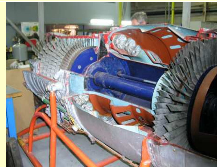
Turboréacteur Atar 8C2 (956) en coupe de Rochefort à restaurer (10/01/2018)