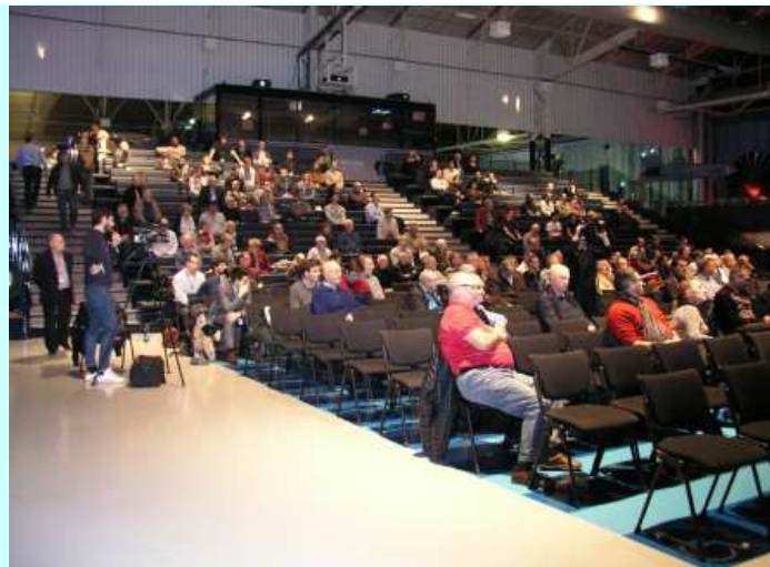
Les présentateurs ont répondu aux questions des membres de l'assistance