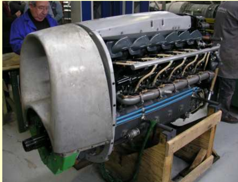
Le moteur Renault 12T de Châteaudun en finition (10/01/2018)