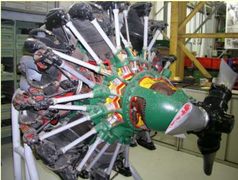
Le moteur Gnome & Rhône 14 N 49 de Rochefort est pris en charge pour restauration, il équipait les avions MB152 et Amiot 351 1060cv 1933 (10/01/2018)