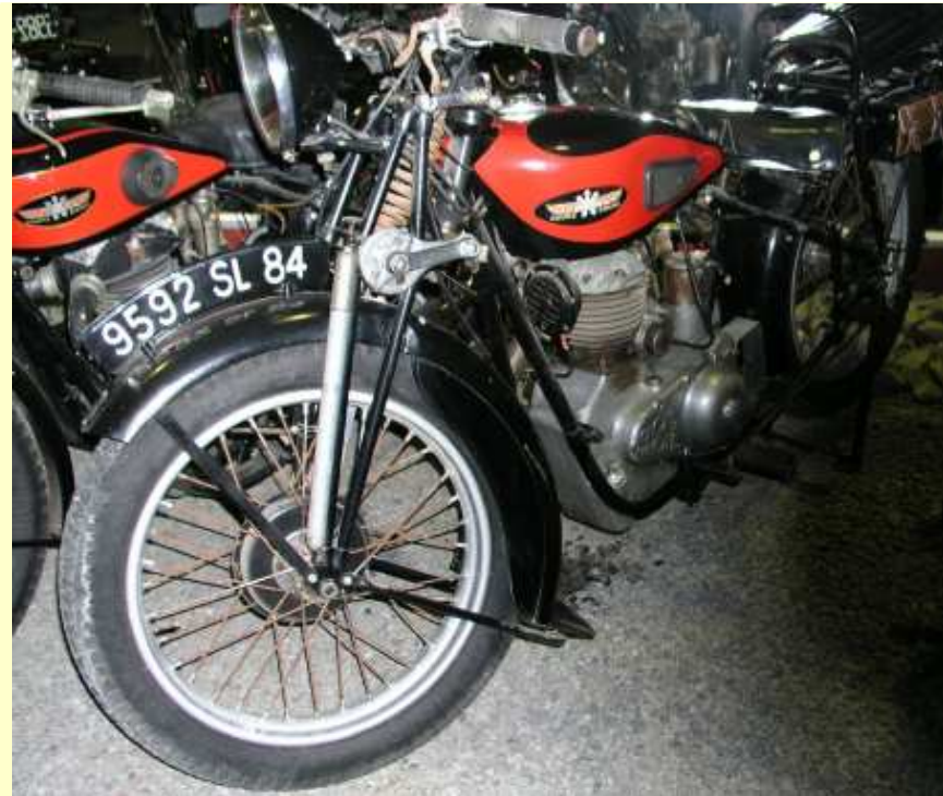
Nouvelle acquisition moto, une G&R M2 (24/01/2018)