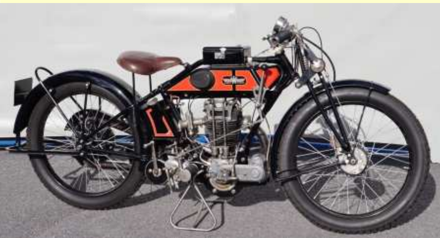
Acquisition AAMS de la moto G&R D2 (12/02/2020)