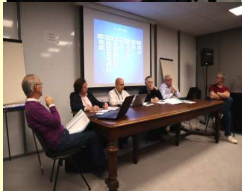
Dépouillement des votes et membres du Bureau