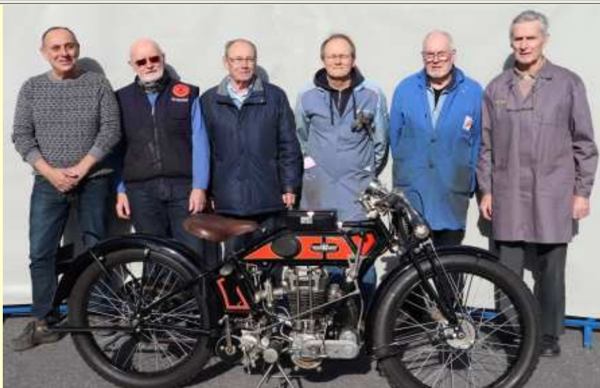
Equipe AAMS des restaurateurs de motos (12/02/2020)