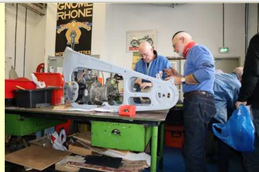
Carter de la moto G&R XA2 (19/02/2020)