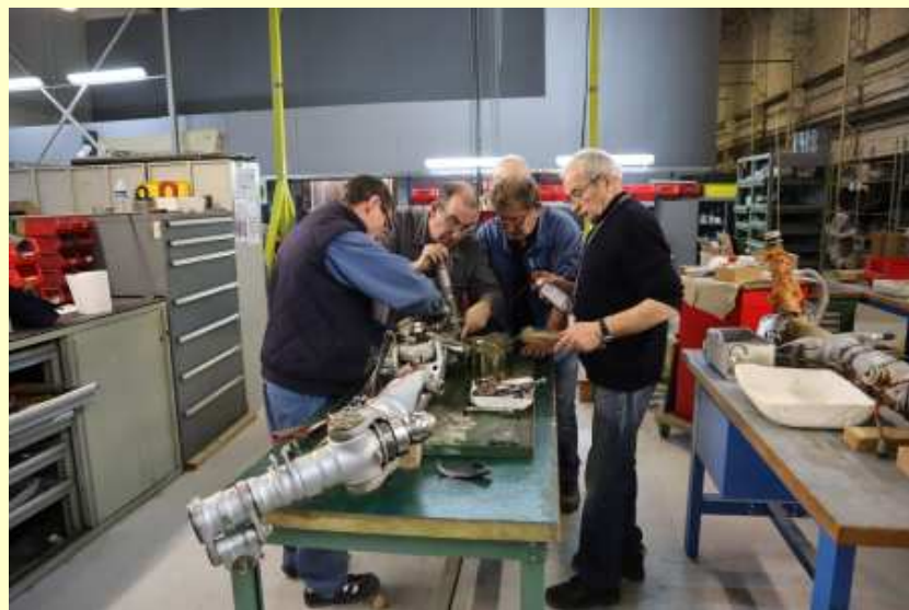
Train principal Mirage III (12/02/2020)