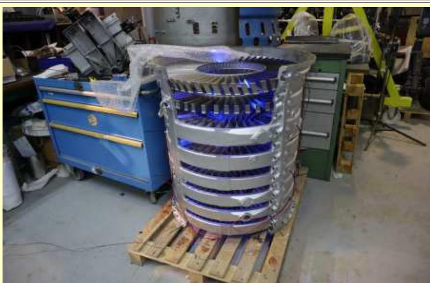
Restauration Atar 9B, en coupe, carter compresseur éclairé par leds