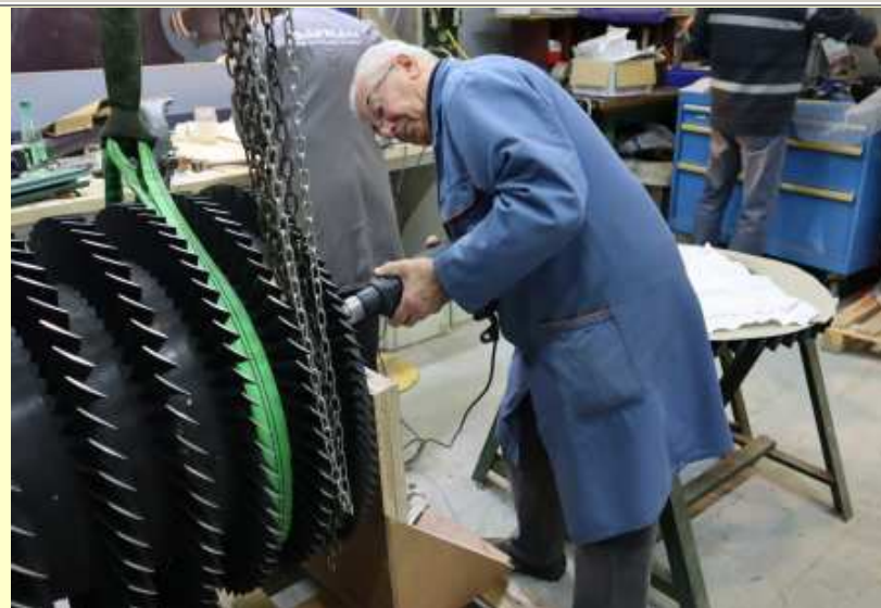
Atar 9B démonté en nettoyage, rotor compresseur (12/02/2020)