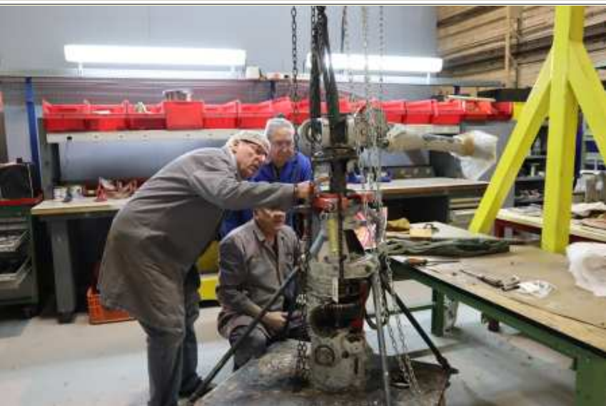
Boîte de Transmission Principale hélicoptère Alouette III (12/02/2020)