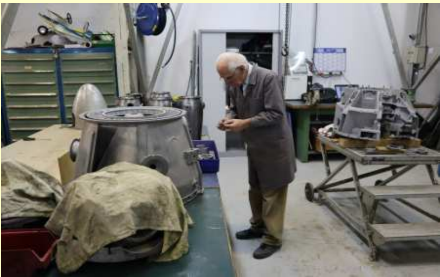
TB 1000 (12/02/2020)