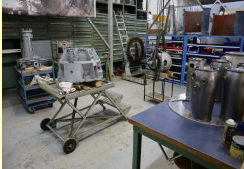
TB 1000 démonté, pièces au nettoyage (12/02/2020)