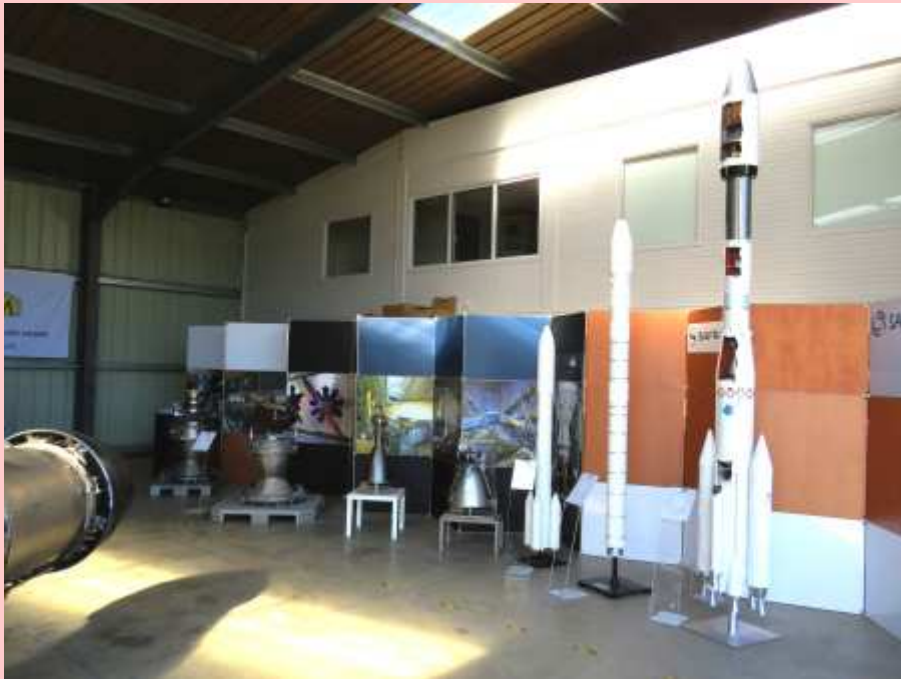
Une vue partielle de l'espace Safran dans le hall mis à disposition à Issoire (28/09/2021)