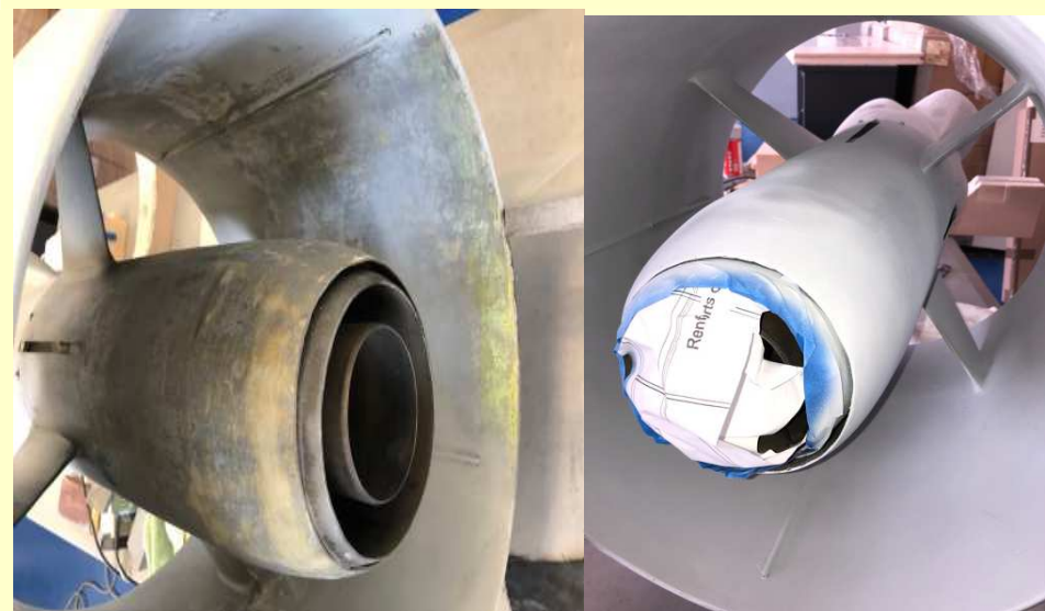
Restauration encours de la maquette du coléoptère dans l'atelier maquette de l'AAMS (01/09/2021)