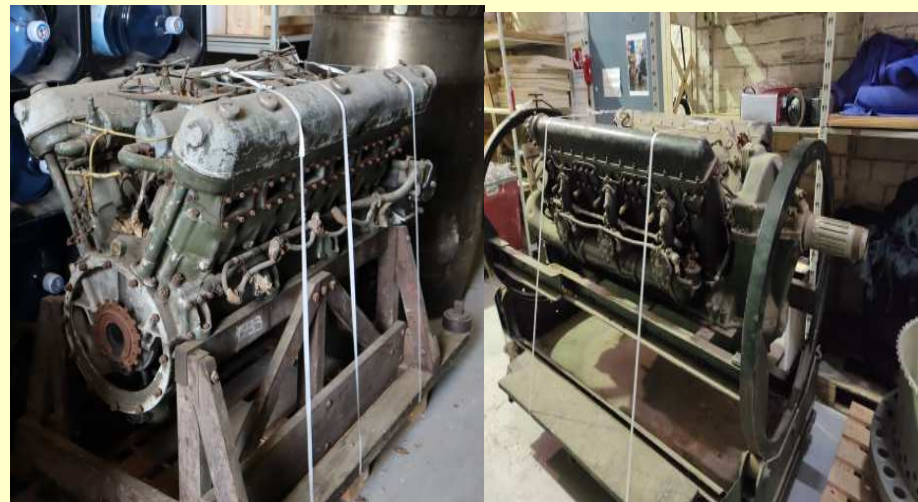
Nouveaux moteurs à restaurer (août 2021)