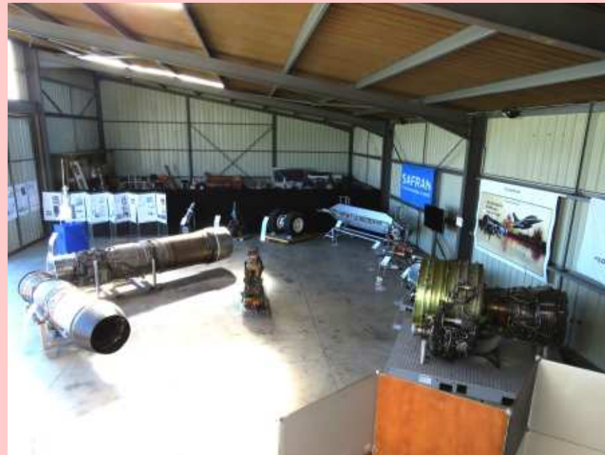
Vue d'une partie de l'exposition Safran (28/09/2021)