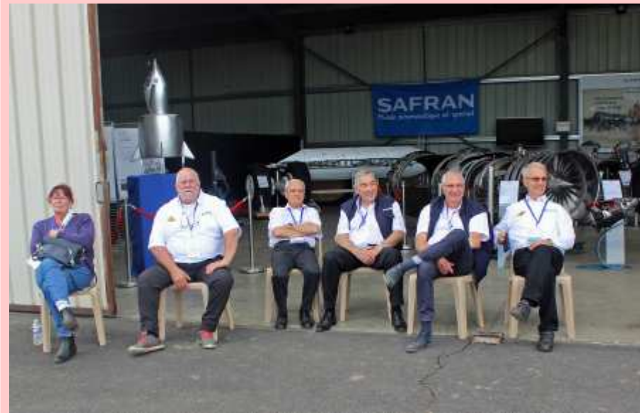
Après l'effort la pause, une partie de nos membres (01/10/2021)