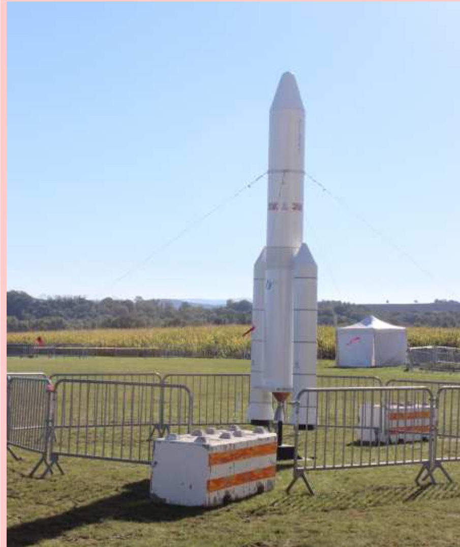
A l'extérieur la maquette 1/10ème de l'Ariane 5 (01/10/2021)