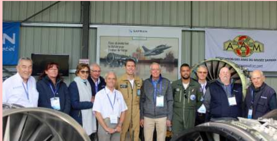
La rencontre appréciée de nos représentants avec le pilote du Rafale et de son mécanicien (02/10/2021)