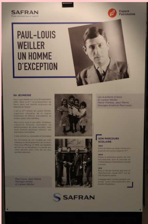
Exposition Paul-Louis Weiller sur mezzanine (courant 2021)