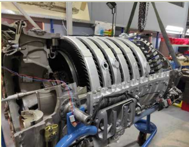
ATAR 9B remontage (26/06/2021)