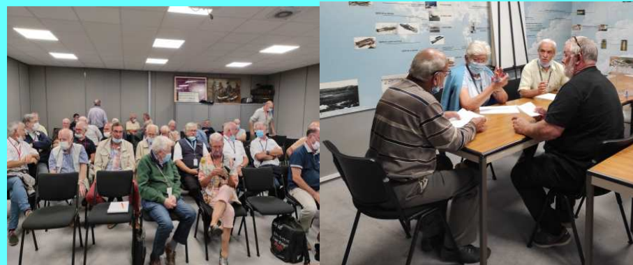
Assemblée Générale AAMS du 22/09/2021 (activité 2020). Vue de la salle et du dépouillement des votes à bulletins secrets pour le renouvellement de 1/3 des membres du Conseil d'Administration