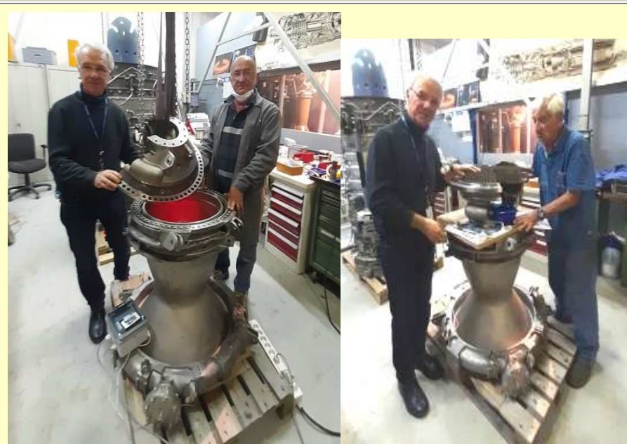
Projet d'injecteur/chambre du moteur Vulcain mené à bien par une équipe de 5 membres AAMS (mai 2021)