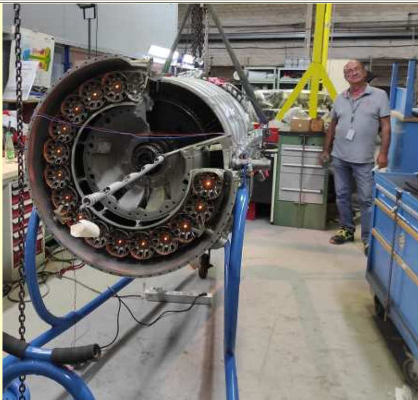
ATAR 9B, injecteurs de la chambre de combustion avec leds (11/08/2021)