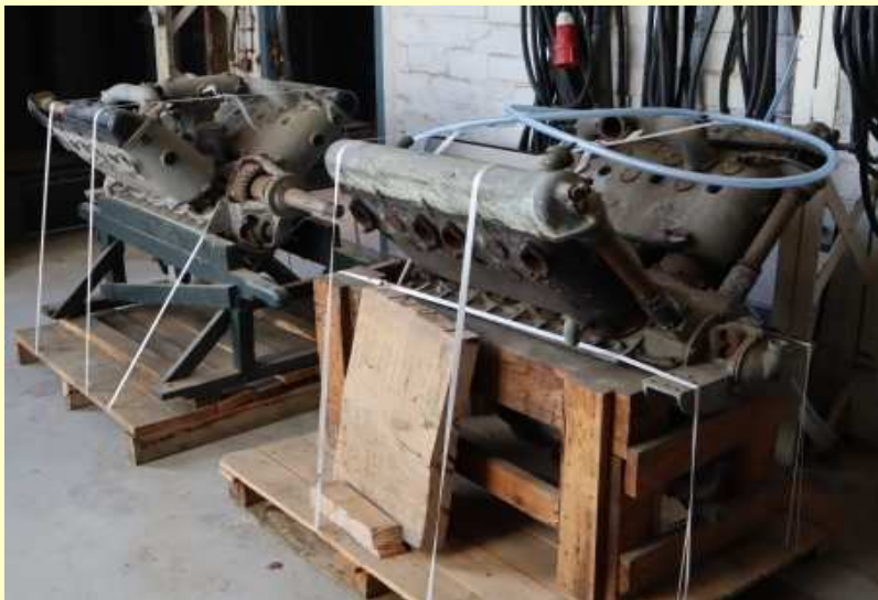
Nouveaux moteurs HS à restaurer (août 2021)