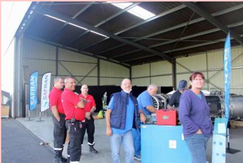
Installation du matériel Safran à Issoire par les membres de l'AAMS (29/09/2021)