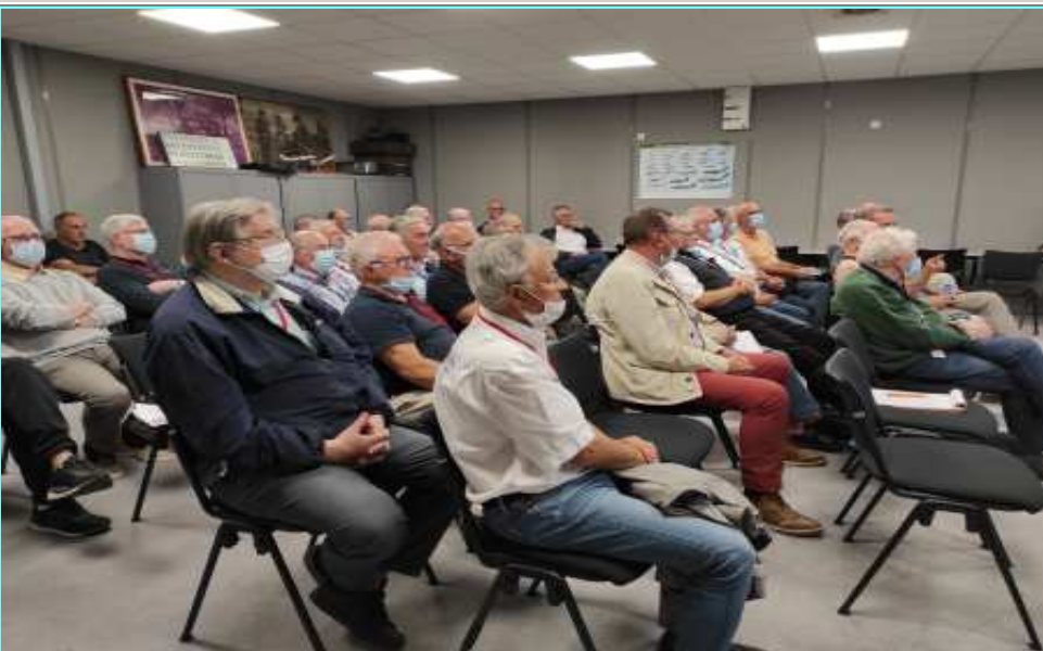
AG AAMS (22/09/2021)