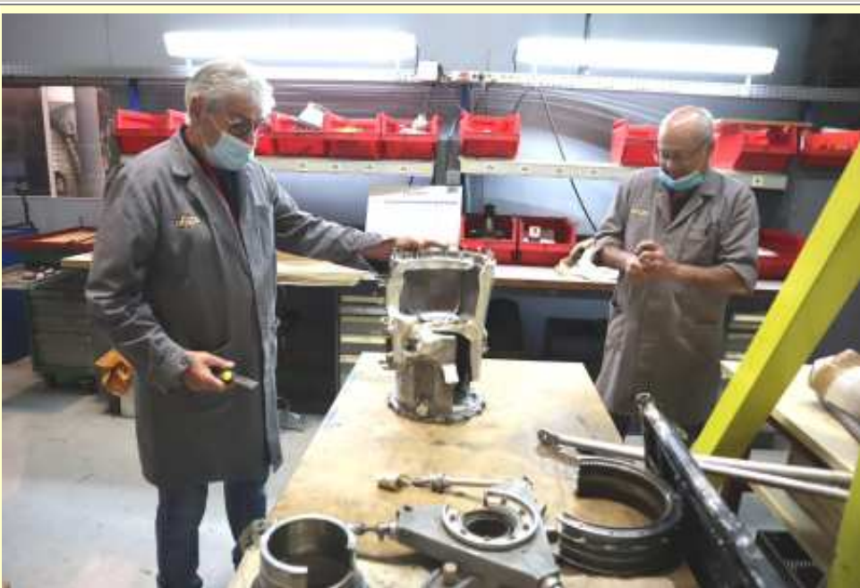
Boite de Transmission Principale Alouette III (23-06-2021)