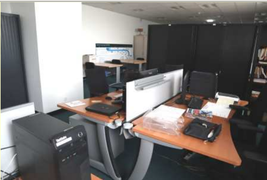
Nouveaux mobiliers dans les bureaux de l'AAMS (mai 2021)