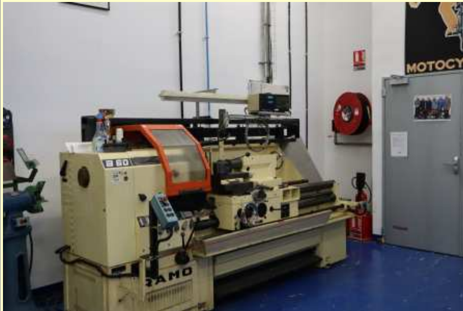
Nouveau tour dans l'atelier motos (19/05/2021)