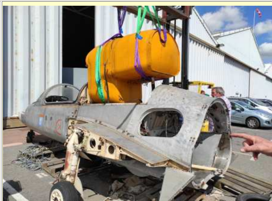
Dépose du réservoir de la carlingue du MS 760 (11/08/2021)