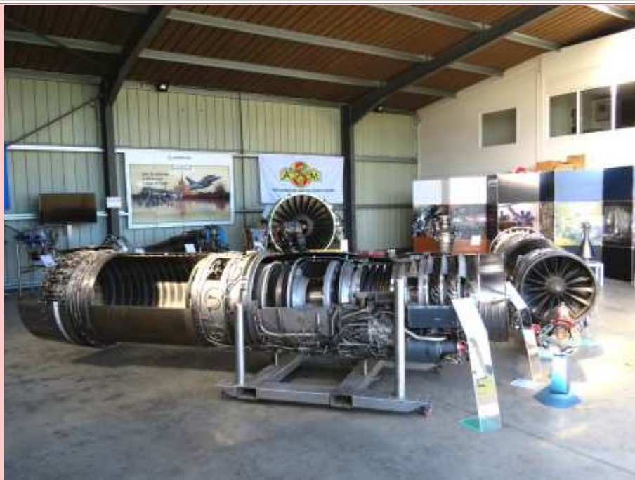
Les moteurs Safran, le M53 réacteur de l'avion Mirage 2000 au premier plan (en coupe) (28/09/2021)