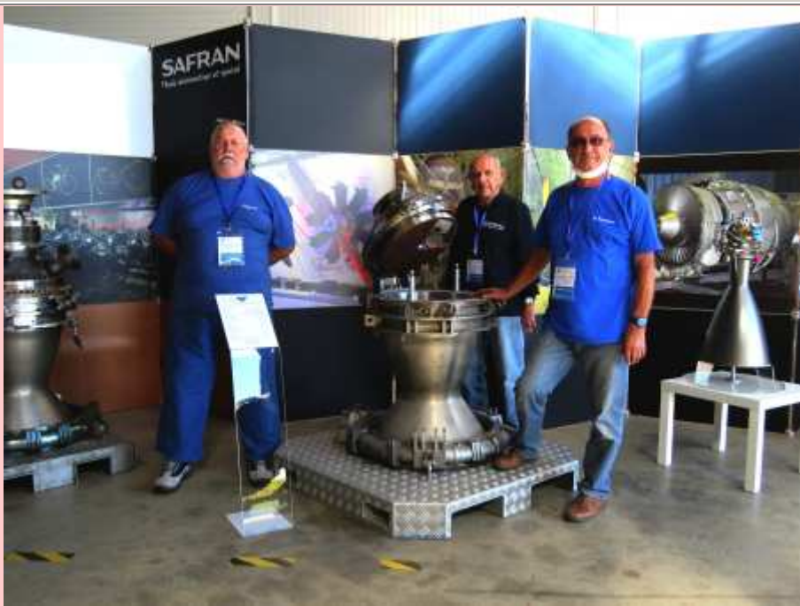
Injecteur du moteur Vulcain (en coupe) (28/09/2021)