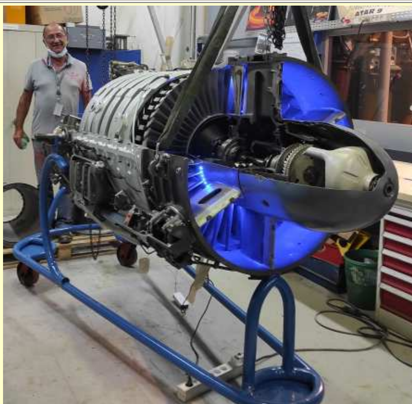
ATAR 9B vue avant avec éclairage interne (11/08/2021)