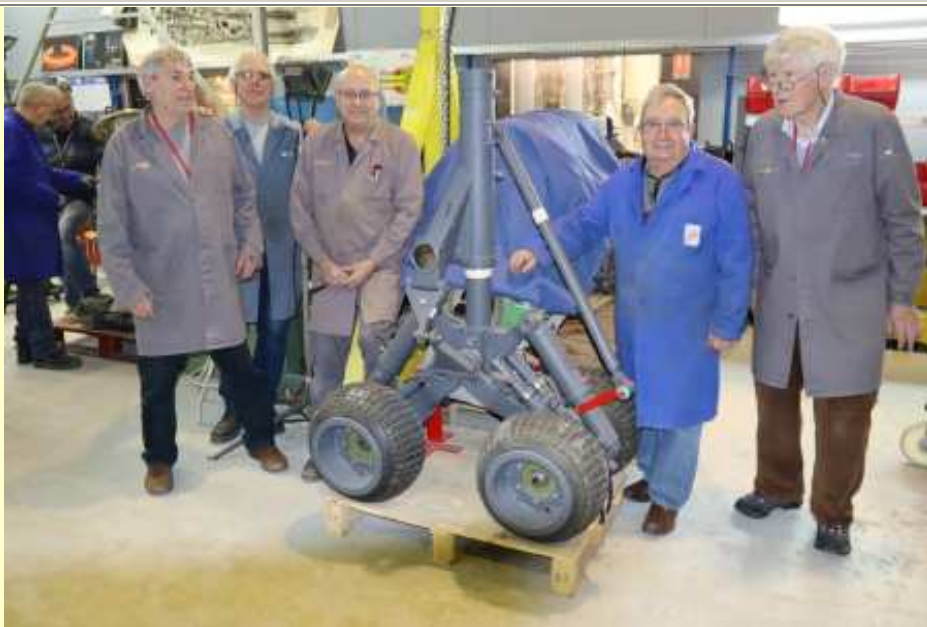
L'équipe de restauration du train automoteur d'hélicoptère Puma (11/05/2021)