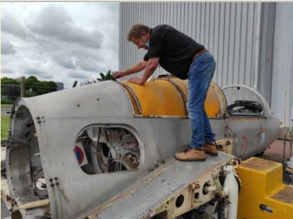
Sur parking du musée démontage du réservoir de carburant (11/08/2021)