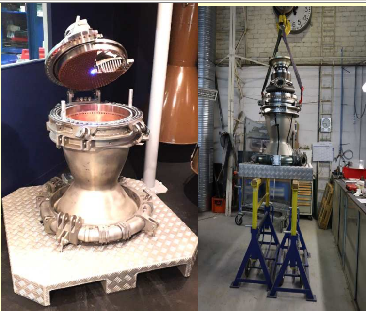
Chambre d'injection du moteur Vulcain sur son support (vue de gauche) pour expositions externes