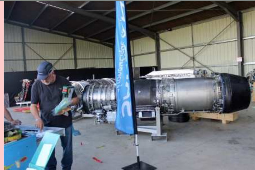
Installation du matériel Safran qui a nécessité 2 camions pour le transport - neuf membres de l'AAMS ont participé à cette manifestation pour le montage/démontage du matériel et l'animation (29/09/2021)