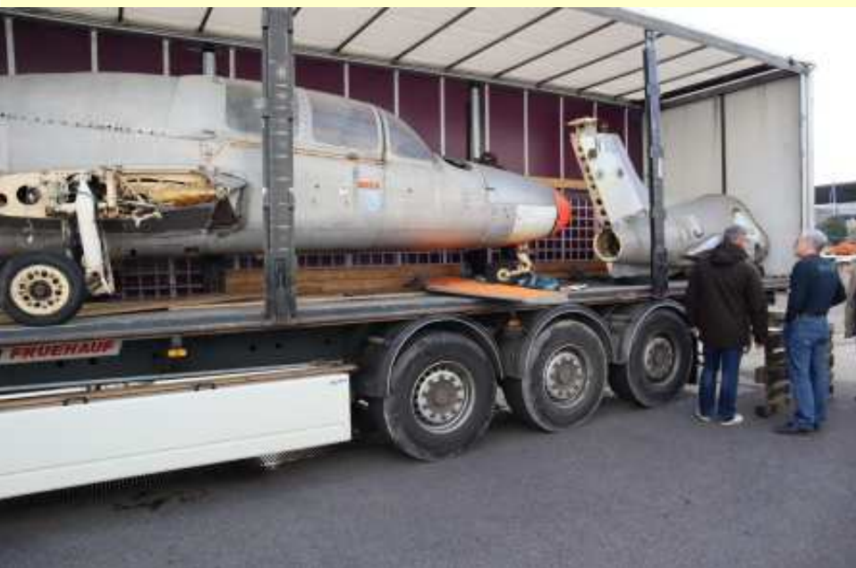
Morane-Saulnier MS 760 livraison sur parking du musée (04/03/2021)