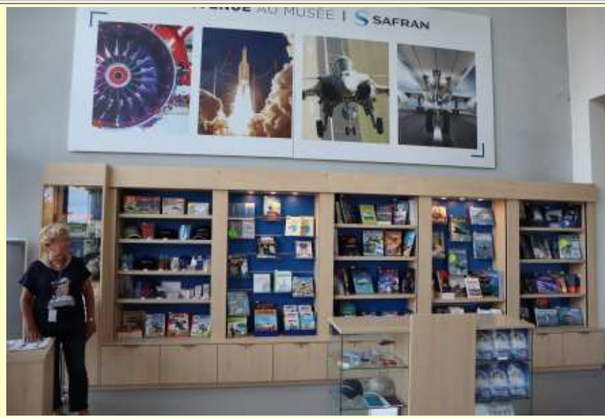
Nouvelle bibliothèque à l'entrée du Musée (photo du 02/06/2021)