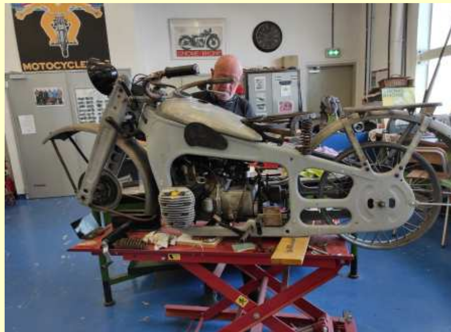
Atelier motos (08/09/2021)