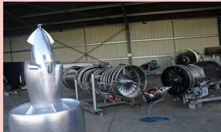
Au premier plan la maquette du Coléoptère (29/09/2021)