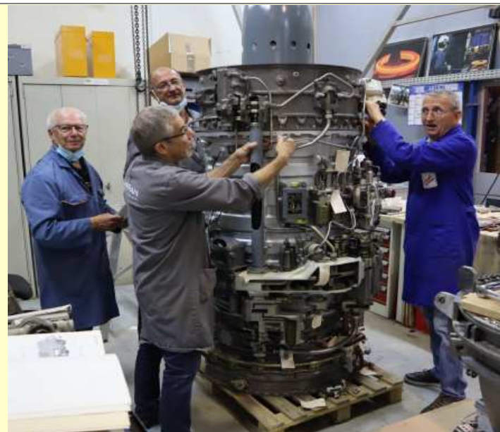
ATAR 9B l'équipe de restauration (23/06/2021)